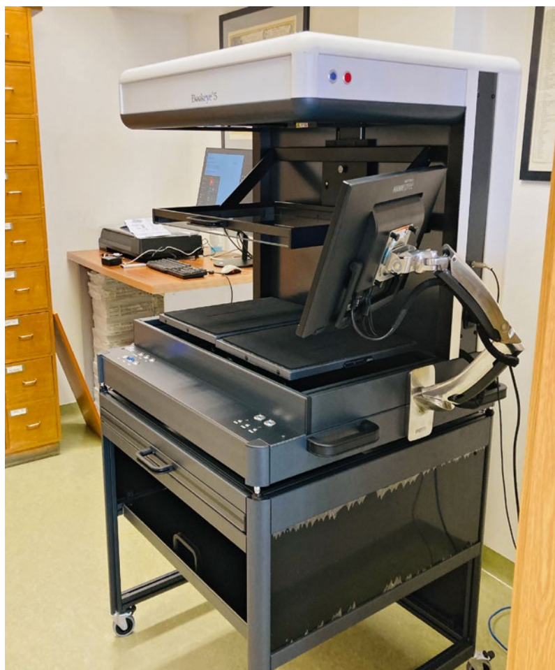
Nový skener Bookeye 5 V2 Semiautomatic ve studovně historických fondů. VKOL získala pro nákup nových skenerů do HF finanční prostředky z Národního plánu obnovy ve výši téměř 1,5 mil. Kč.