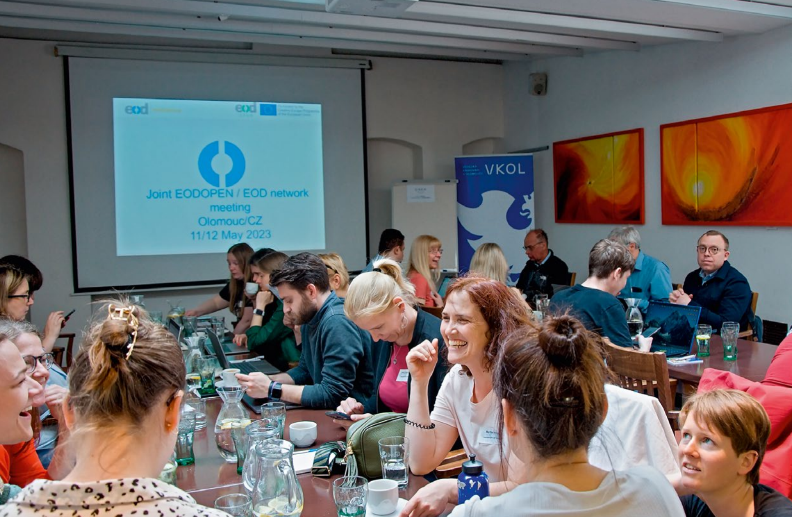
V květnu se v Olomouci uskutečnilo jedno ze setkání v rámci projektu EODOPEN.