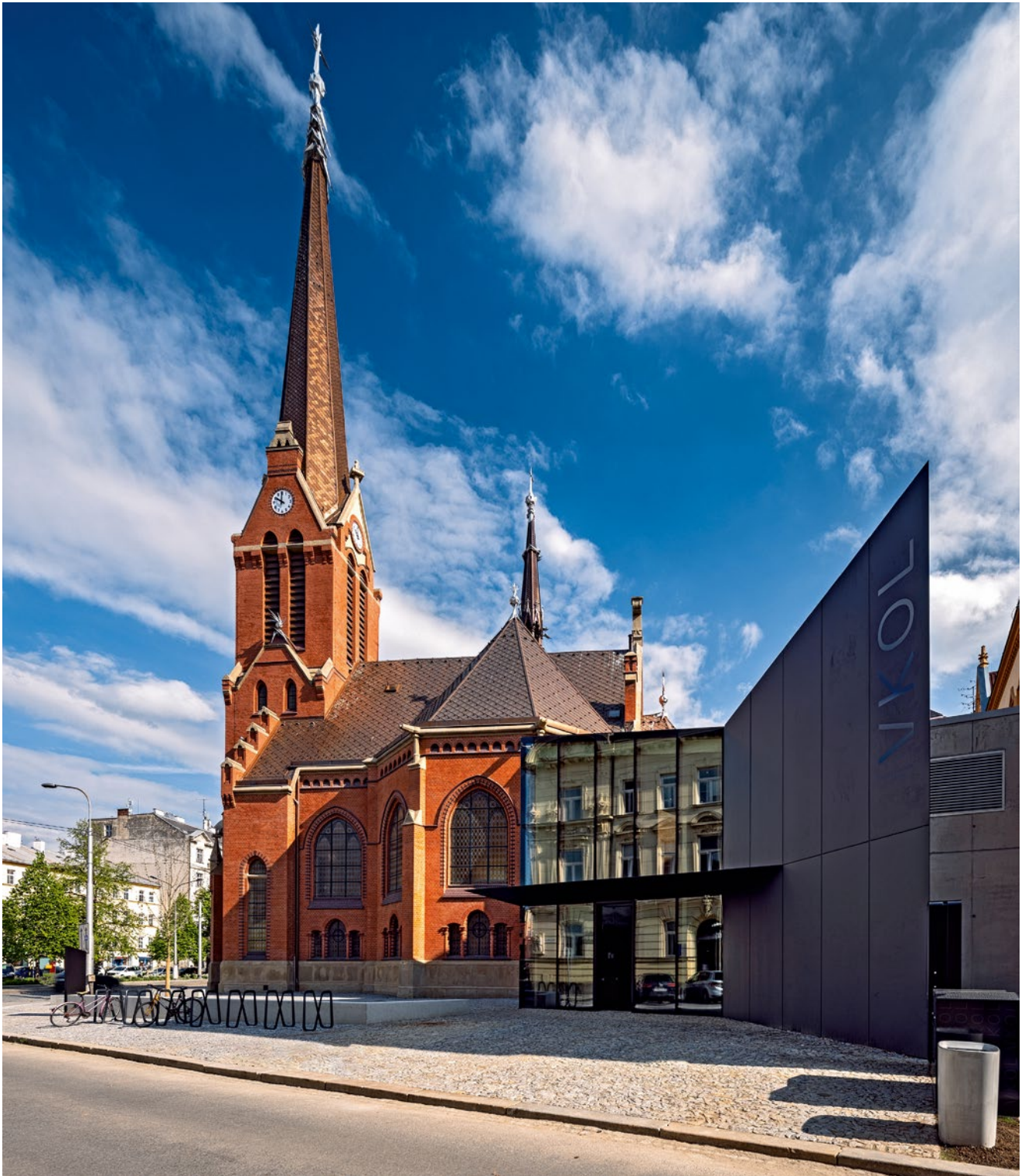
Červený kostel s novým foyer VKOL byl slavnostně otevřen 17. května 2023.