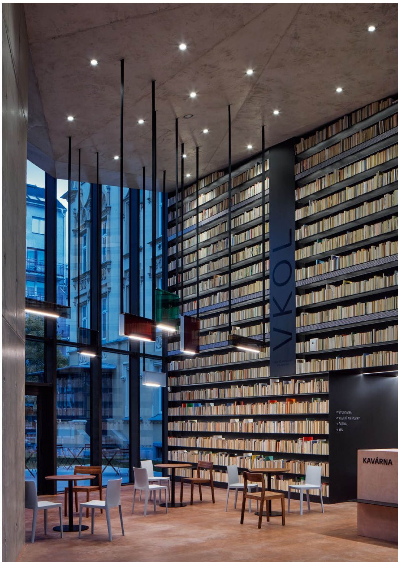
V novém foyer VKOL mohou návštěvníci využít služeb kavárny, kterou od září 2023 provozuje TRAFFIC COFFEE s.r.o.