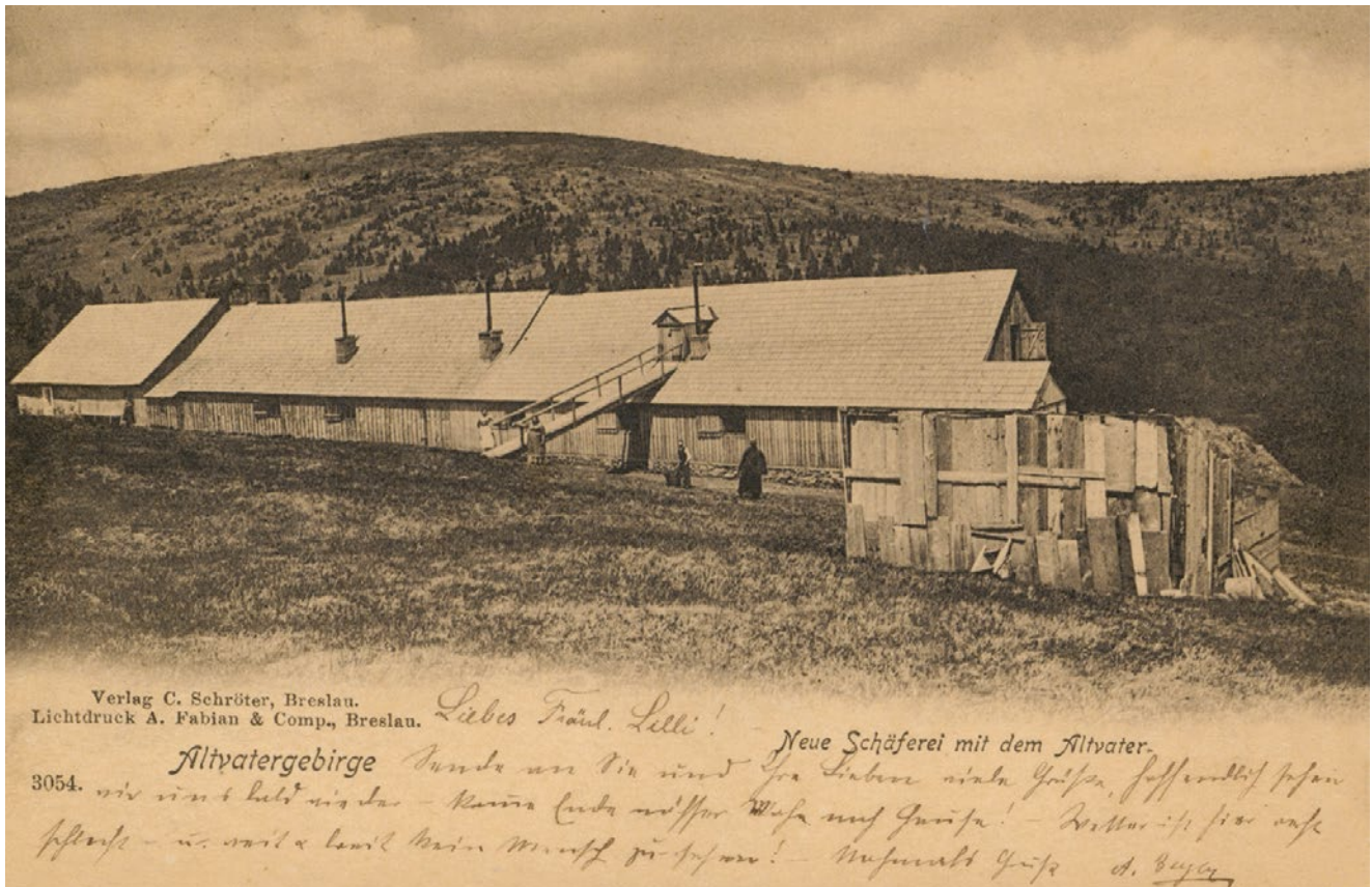
Ovčárna. Pohlednice z tzv. jesenické série watslavského vydavatele C. Schrötera z roku 1899, VKOL, sign. G 3123.