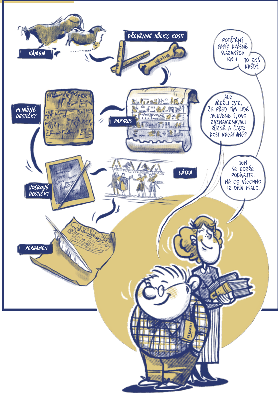
Ukázka karty z výukového programu Otevři si vlastní knihovnu.