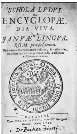
Obrázok č. 2: Knižné vydanie Schola Ludus vytlačené v Blatnom Potoku v roku 1656