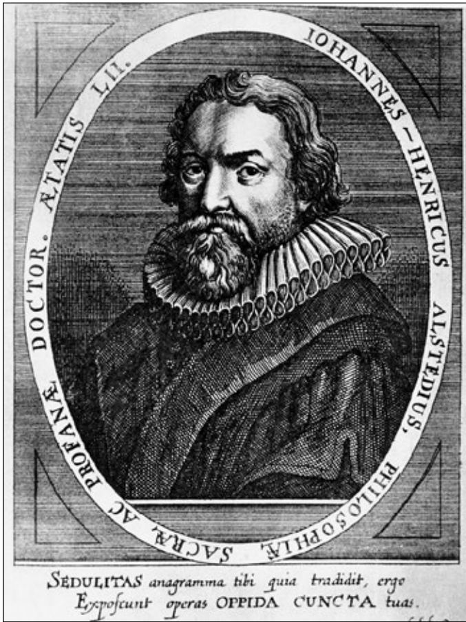
Obrázok č. 1: Podobizeň Johanna Heinricha Alsteda (1588–1638)